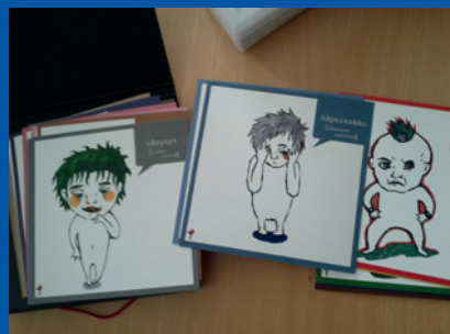
Kuovola, Suomija. Įvairaus amžiaus ir išsivystymo lygio vaikų apklausose naudojama medžiaga.