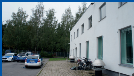
Estija. Atskiras jėjimas iš kitos Tartumos aukų paramos centro pastato pusės.

Estijoje, Tartumos aukų paramos centre (est. Tartumaa Ohvriabikeskus ) iš kitos pastato pusės įrengtas atskiras jėjimas labai stipriai traumuotiems vaikams. Kai kuriuose teismo pastatuose Suomijoje taip pat yra atskiri jėjimai, o Jungtinėje Karalystėje teismo pastatuose įrengti atskiri jėjimai ir laukiamieji yra laikomi dideliu teismų privalumu.